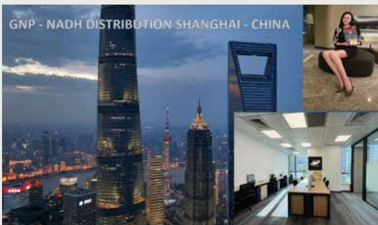
GNP - NADH DISTRIBUTION SHANGHAI - CHINA