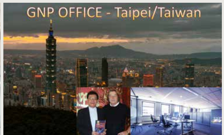
GNP OFFICE - Taipei/Taiwan