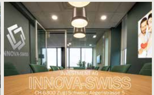
INNOVA-SWISS INVESTMENT AG CH-6300 Zug | Schweiz, Aegeristrasse 5